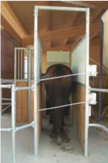
In dem Fressständer (li.) können die Pferde ungestört ihre Kraftfütterration genießen. Direkt an den Offenstall grenzen die Weiden (re.), die ganzjährig offen sind.