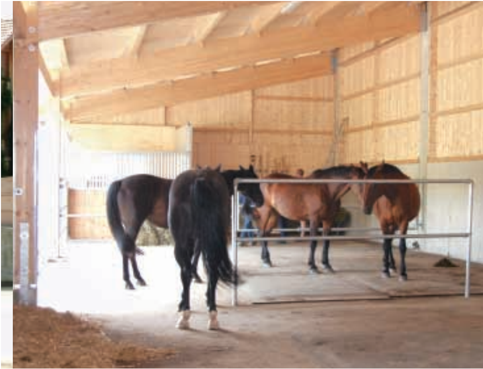
In der ersten 170 Quadratmeter großen Liegehalle wurden Ruhezeiten für einzelne Pferde durch stabile Gitter geschaffen. Dazwischen befinden sich dicke Gummimatten, die die Pferde gerne zum Schlafen benutzen.